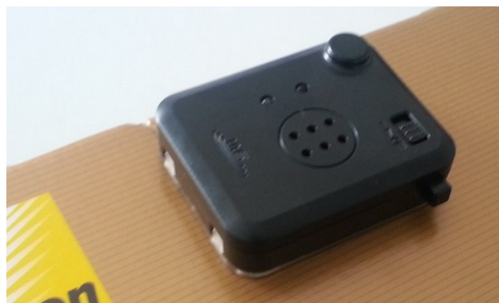
Ninja Tag mit Carrier